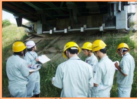
こつらい ▲幸来橋点検

初めて間近でみる除雪機の大きさに驚いていました！ 除雪グレーダにはレバーが10本もあり、大変そうです。