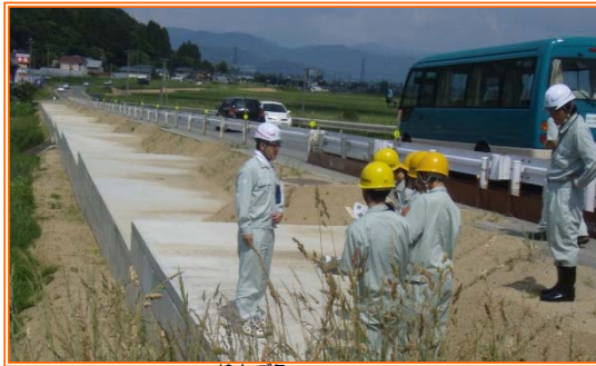
▲南陽市 梨郷歩道予定箇所見学