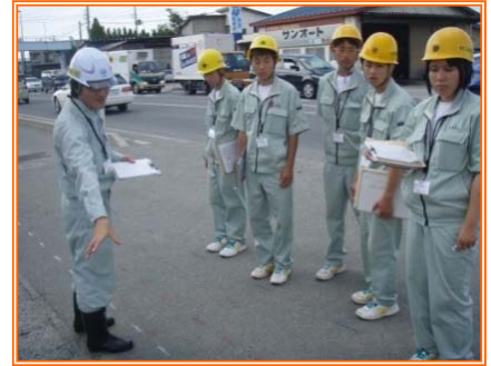
▲占用、承認工事見学