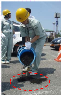
①凹みに常温合材（アスファルト）を敷き詰めます。

道路パトロール中に路面の凹みを見つけたら、応急処置をします。高校生に体験していただきました。