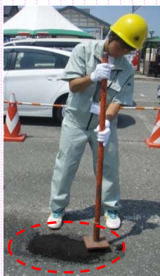
②器具でしっかり固めて完成です。