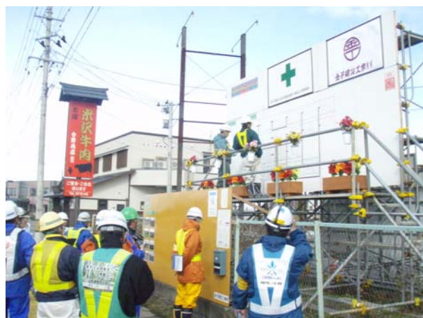
▲現場事務所の掲示板の点検