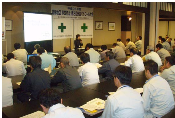
▲置賜保健所 地域保健予防課 講師による講話

指摘事項は既に改善されており、今回パトロールを実施した現場だけでなく、すべての工事現場において安全対策に努め、引き続き『安全第一』で、工事を進めてまいります。