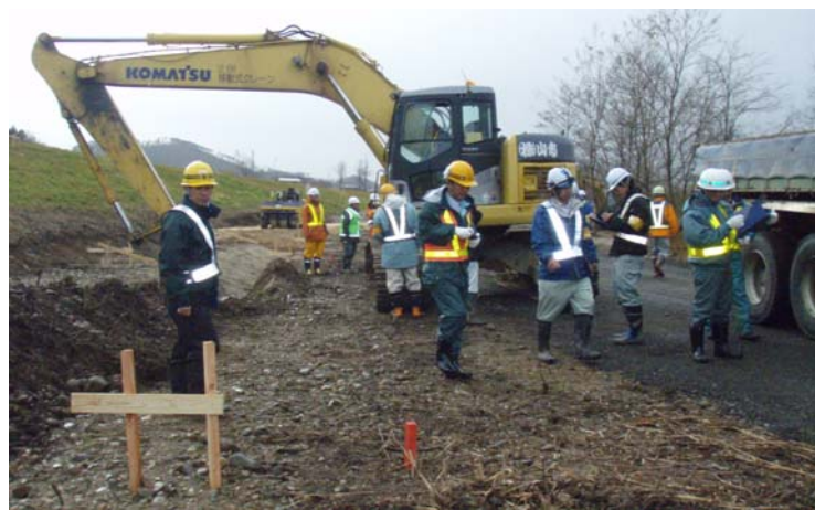
▲河川敷での堤防強化工事現場では、重機での作業の安全性などを点検