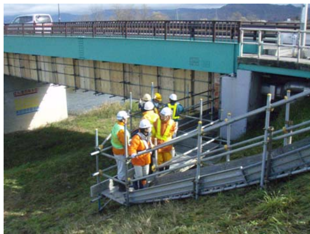
▲橋梁補修工事現場では、橋の下の作業足場の安全性などを点検

発注者および受注者あわせて85名が参加し、工事現場の点検および検討会を行い、さらに「メンタルヘルス（こころの健康）」と題した講話を聴講しました。