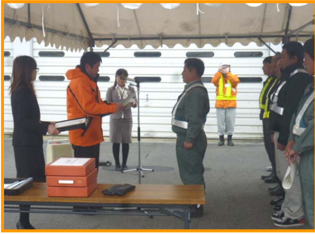
▲除雪従事功労者へ表彰状の授与