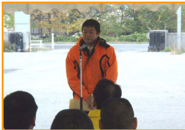
▲井上事務所長による挨拶