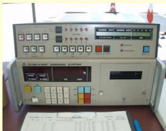
▲重さが表示されます