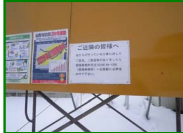
現場事務所の電話番号を 近隣にお知らせしている