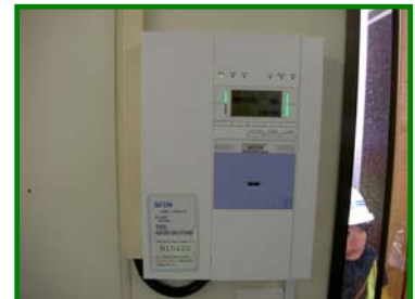
警備補償会社に委託