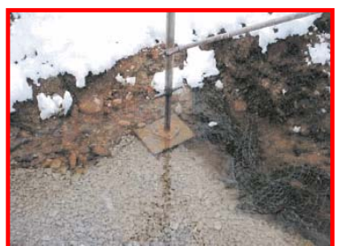
足場の設置位置が水中にある