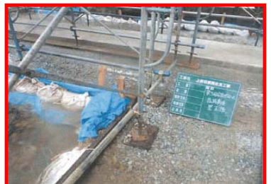
土のう・板柵により排水溝を補強し、 基礎探石の上を流水しないようにした

＜講評：今野事業対策官＞ ・H24. 12. 15～H25. 2. 15冬の労災をなくそう運動を実施中(山形労働局・労働基準監督署) ・同じ指摘を受けないように、自分の現場を見直そう！