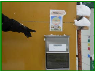
工事概要のチラシの設置