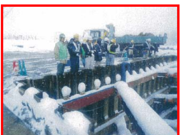
橋脚現場に転落防止柵がない