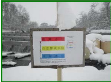
河川の水位表示が見やすい