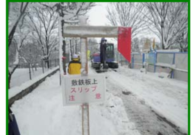
路肩表示がわかりやすい