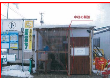
中柱で補強・釘の除去