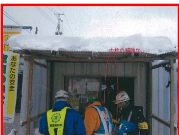
現場事務所の屋根の強度不足・ 釘が出ている