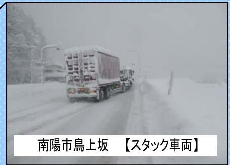
南陽市鳥上坂 【スタック車両】