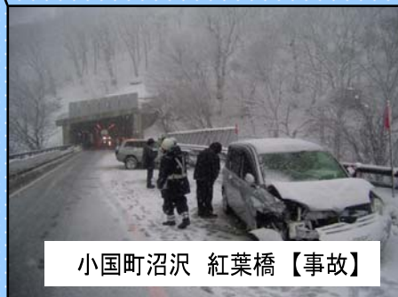
小国町沼沢 紅葉橋 【事故】