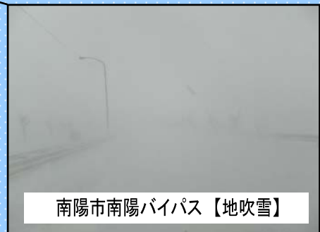
南陽市南陽バイパス 【地吹雪】