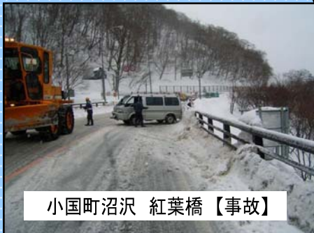
小国町沼沢 紅葉橋 【事故】