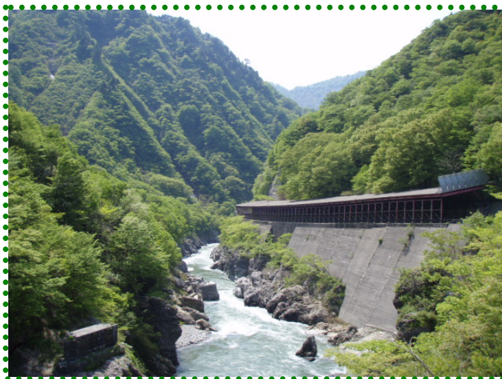
磐梯朝日国立公園・赤芝峡(77.6kp)

道路は公共の財産です。みんなが気持ち良く利用できるように、ゴミはポイ捨てをやめて持ち帰るようにご協力をお願いします。