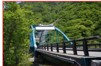
向大沢橋L=123m(76.22kp) 景観になじむトラス橋です。