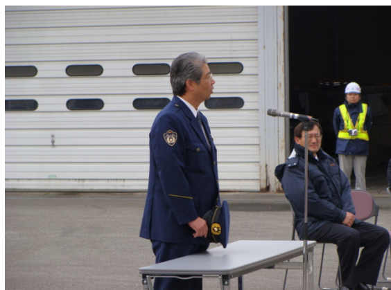
交通安全訓示: 米沢警察署交通課長