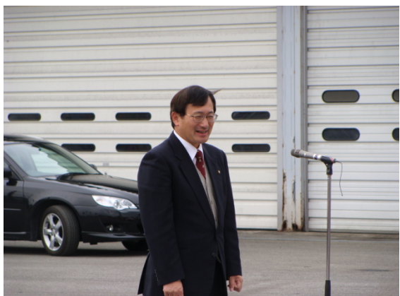
あいさつ: 米沢市長

当出張所では、国道13号（米沢市刈安～南陽市元中山）及び国道113号（新潟県境～高畠町深沼）の100.7kmの除雪を行っています。5つの除雪ステーション（刈安・赤湯・南陽・沼沢・小国）に46台の除雪機械を配備し、24時間体制で円滑な冬期交通の確保を目指します。