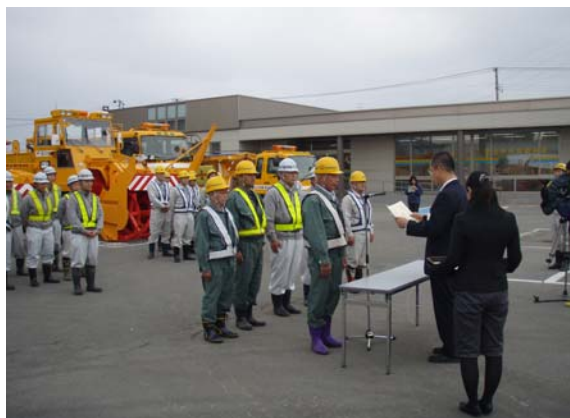
除雪功労者6名に感謝状が贈られました