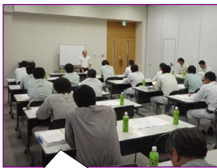
安全講話の様子です。情報を共有し、安全に工を進められるよう現場代理人さんは真剣です！