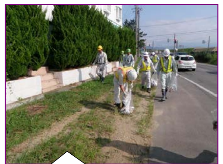
美化活動として工事現場の近隣のゴミ拾いをしました！