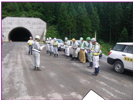
良いところは自分たちの現場に取り入れられるように、全員で点検箇所を確認して現場をパトロールします！

今年度はじめの安全協議会では、4/27に安全祈願際を行い工事の安全を祈願しました。 また、現場のパトロールや安全講話などの活動を行い工事事故防止に努めています！