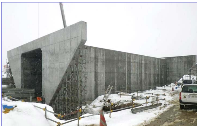
↑ 道路ボックス全体 (3月中旬)