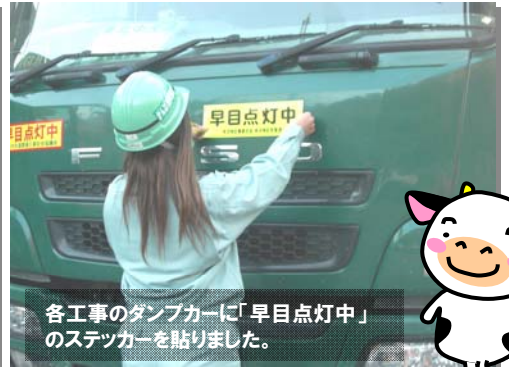
各工事のダンプカーに「早目点灯中」のステッカーを貼りました。