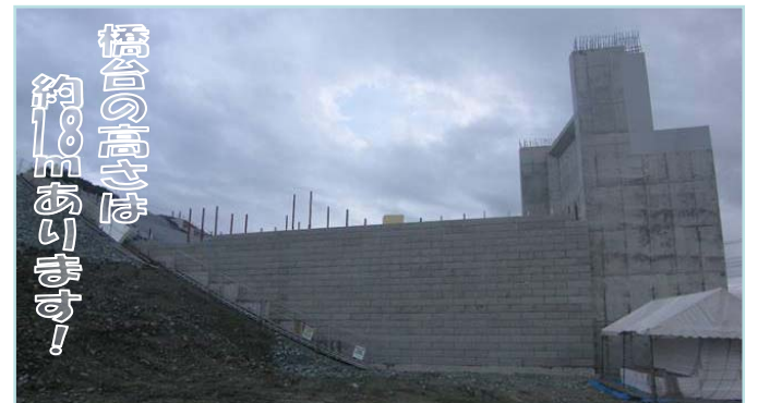
橋台の横からの様子

毎日真年中、作業お疲れ様です。これからも暑い日が続きますが、お体に気をつけて頑張ってください。