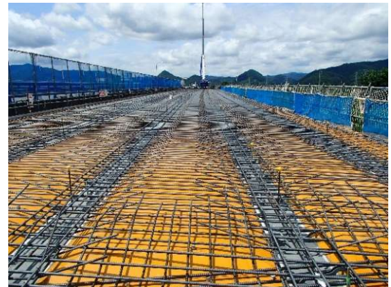
▲鉄筋を敷設したところ