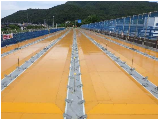
▲型枠を組んだところ

山形国道維持出張所は、国道13号上山市須川橋において、交通の円滑化のため、橋の幅を拡げて2車線から4車線に拡幅する工事を行っております。橋の骨組みとなる部分が完成し、9月にコンクリートを流し込む作業(打設)を行いました。