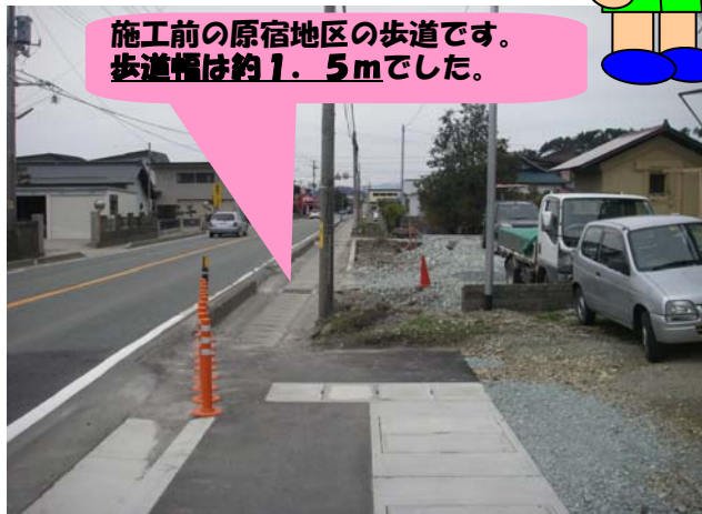
施工前の原宿地区の歩道です。歩道幅は約1.5mでした。