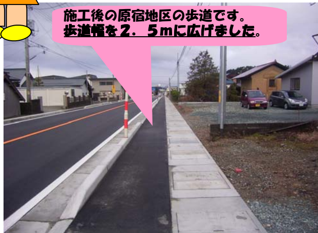
施工後の原宿地区の歩道です。歩道幅を2.5mに広げました。