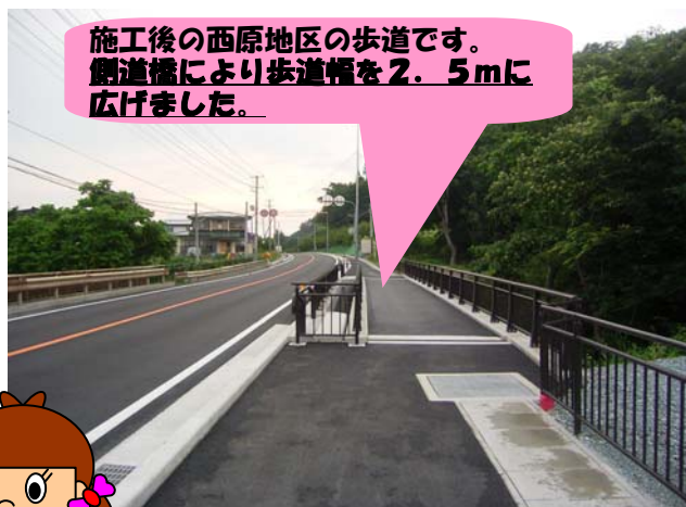
施工後の西原地区の歩道です。側道橋により歩道幅を2.5mに広げました。