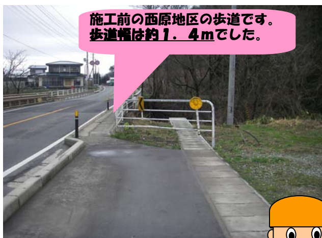
施工前の西原地区の歩道です。歩道幅は約1.4mでした。