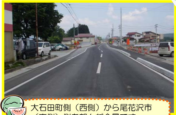
大石田町側（西側）から尾花沢市（東側）側を望んだ全景です。