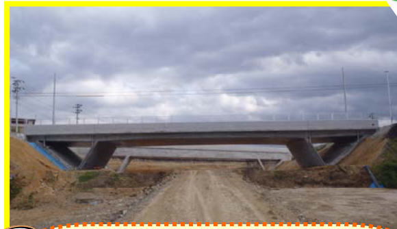
尾花沢こ道橋を北側（新庄側）から望んだ状況です。事業完成後は、この橋の下を東北中央道として車が走行します。