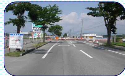
市道迂回路の状況です。