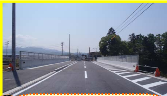
尾花沢こ道橋を尾花沢側から大石田側を望んだ状況です。約1年間に渡り橋梁工事を行ってきましたが、無事、5月29日（火）に開通しました。

橋梁名は県道を管理する山形県及び地元の尾花沢市と協議し、「尾花沢こ道橋」に決定しました。この橋梁形式は「 \pi （パイ）型ラーメン橋」といい、橋の形がギリシャ文字の「 \pi （パイ）」の字に似ていることから橋の構造名称となっている、珍しい形の橋梁です。（第16号で橋梁工事紹介）