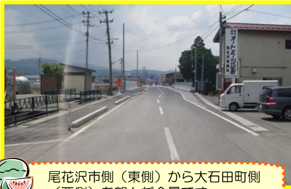
尾花沢市側（東側）から大石田町側（西側）を望んだ全景です。

昨年、6月11日（土）に通行を迂回路へ切り替えし工事を進めておりました、県道尾花沢大石田線の工事（橋梁工事及び前後の拡幅工事）が5月29日（火）に完了し、本線へ通行を切替えしました。工事中は通行するドライバー及び歩行者の皆様には、ご不便をおかけしました。