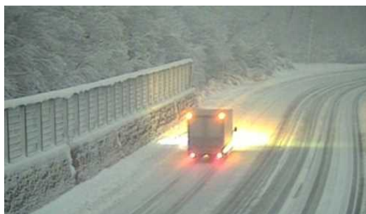
月山第1トンネル付近カメラ画像