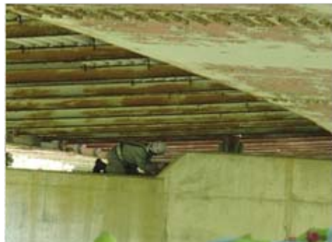
橋の下の点検箇所は立って歩けないところもたくさんあります。