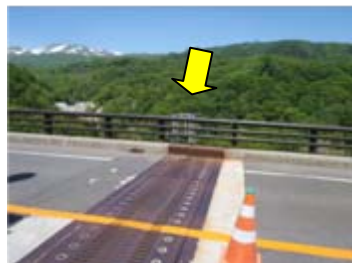
橋梁の管理用はしごから降りていきます。