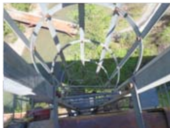
上から見たところ…。高い！