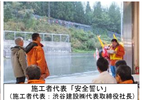
施工者代表「安全誓い」 (施工者代表: 渋谷建設(株)代表取締役社長)