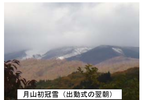
月山初冠雪(出動式の翌朝)