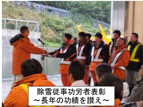
除雪従事功労者表彰 ～長年の功績を讃え～