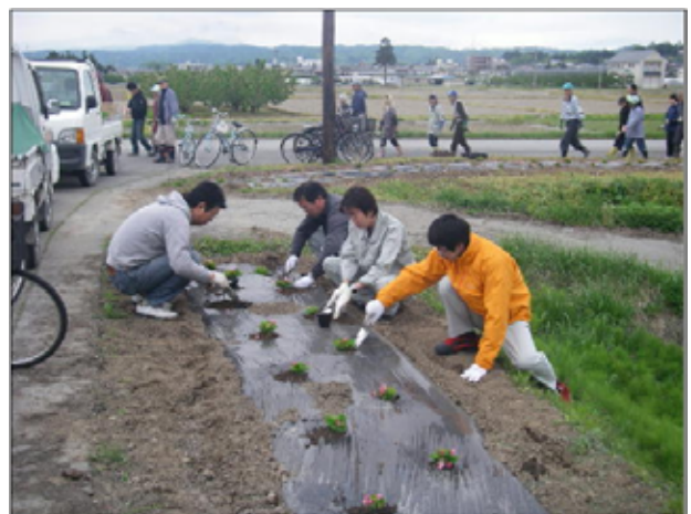
出張所職員も参加しました