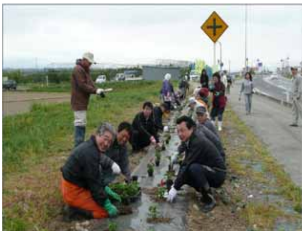
西根地区の植栽の様子