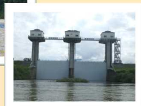
大 旦 川 水 門