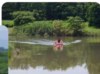
▼黒井堰 松川水路橋