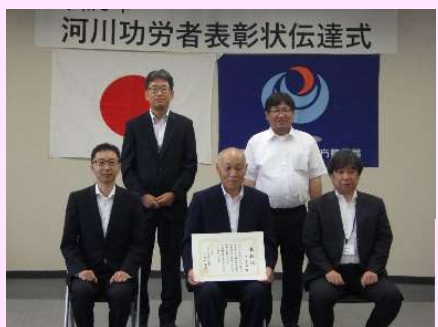
平さんの表彰状伝達式が行われました。

長年にわたり河川に関する活動での功績と国土交通行政の推進に顕著な功績があったとして、南陽出張所管内の水門等水位観測員5名の方が表彰されました。水門等水位観測員は、国土交通省が管理する最上川をはじめとする河川に設置している、河川管理施設の点検や操作を行い、河川周辺地域の安全を守るために従事されています。