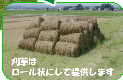
刈草は ロール状にして提供します