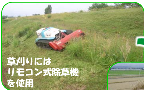
草刈りには リモコン式除草機 を使用