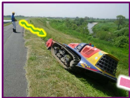
▲リモコン式除草機を使用