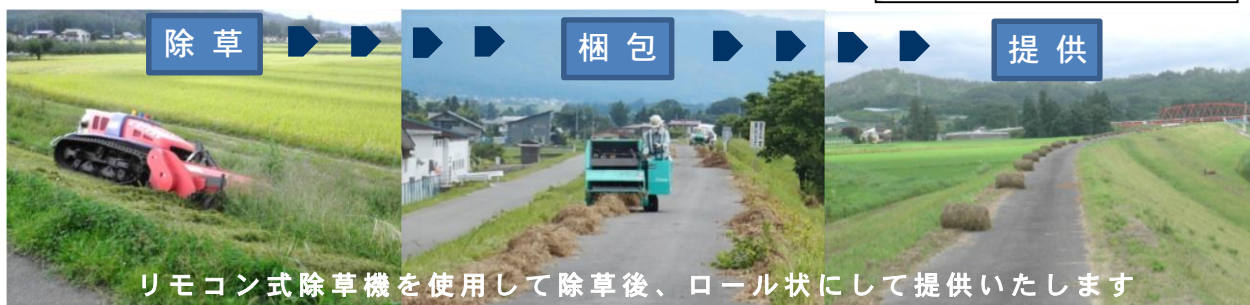
リモコン式除草機を使用して除草後、ロール状にして提供いたします