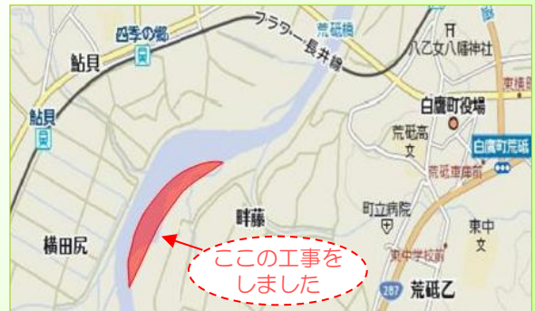
この工事を しました