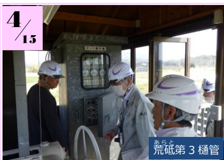
あらと 荒砥第3 樋管