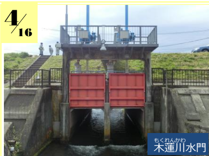
ちくれんかわ 木蓮川水門