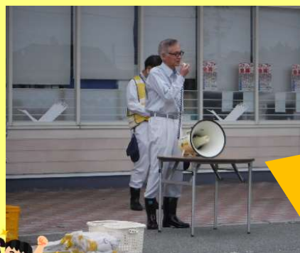
尾花沢市長の挨拶

今年度は6月11日（日）に植栽されました。早朝にも関わらず沢山のボランティアに参加いただき、道端が今年も華やかになりました！ボランティアの皆様ありがとうございました！