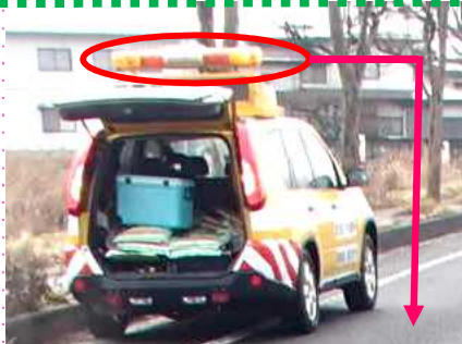
パトロール中は、黄色のランプが点灯しています。