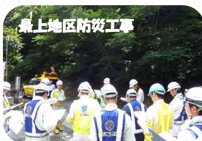
現場代理人による工事概要の説明