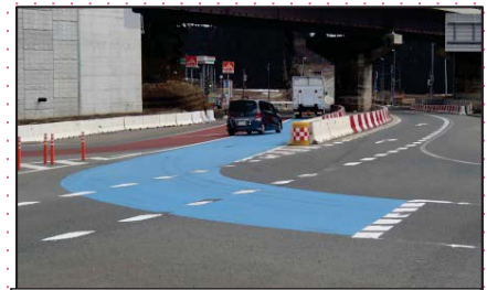
合流部における車道のカラー化

昨年度は東北中央自動車道や国道13号において、注意喚起看板の設置や、交差点における合流注意喚起のため、車道のカラー化を行いました。