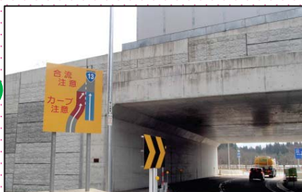
合流・カーブ注意の注意喚起看板