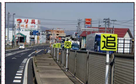
追突注意の注意喚起看板