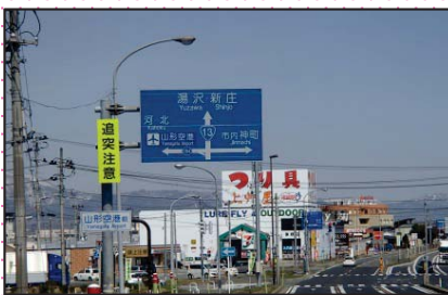
追突注意の注意喚起看板