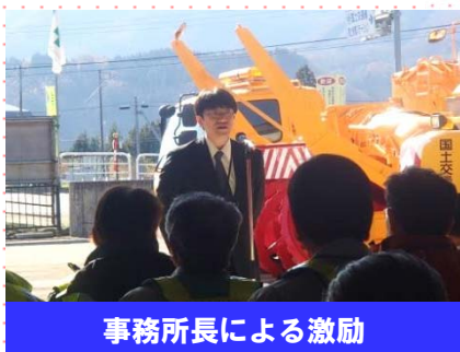
事務所長による激励