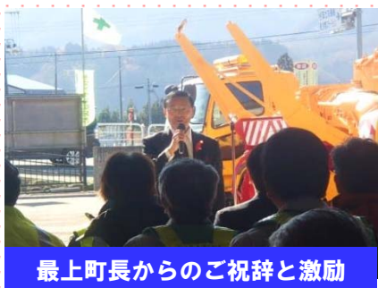
最上町長からのご祝辞と激励