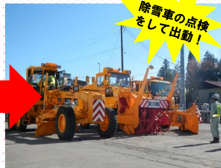
除雪車の点検をして出動！