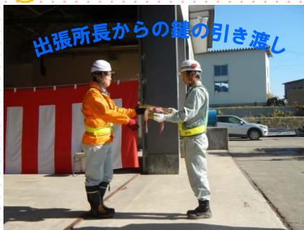
出張所長からの鍵の引き渡し