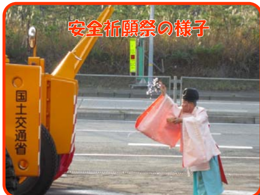
安全祈願祭の様子

今冬も安全・快適な冬道を目指し除雪に努めていきたいと思っておりますので、みなさまのご理解とご協力をお願いいたします。