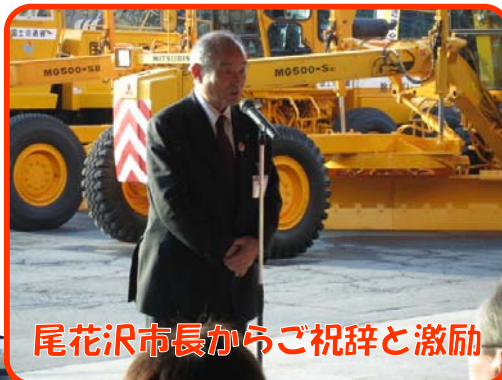
尾花沢市長からご祝辞と激励