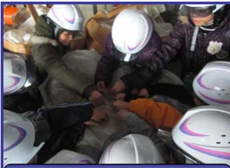
みんな触ってみて 塩の粒が大きいね！