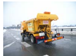
▲凍結抑制剤散布車