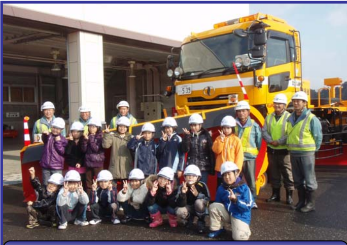
除雪車の前で記念撮影