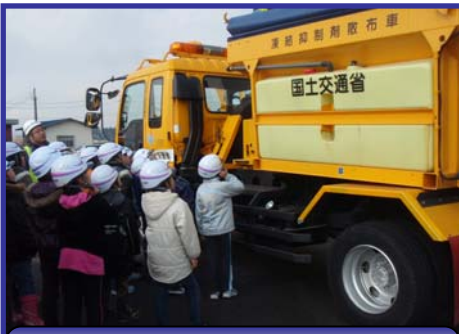
凍結抑制剤散布車 ここに塩が入っています