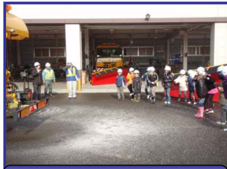
凍結抑制剤散布車実動 「こんなに遠くまで飛ぶんだね」