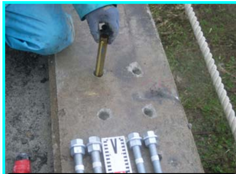
まず接着剤を入れて