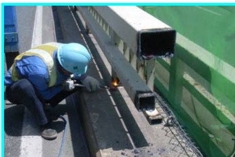
ガスで切断します