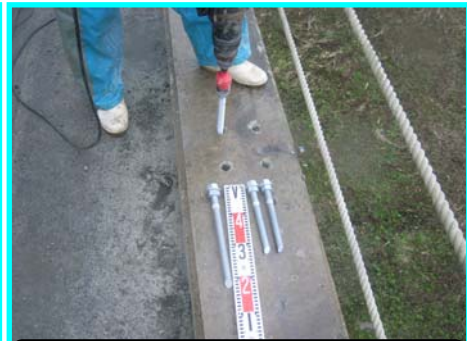
アンカーボルトを設置します

今回使用している接着剤は、化学反応を利用してアンカーボルトを固定する役割を果たします。