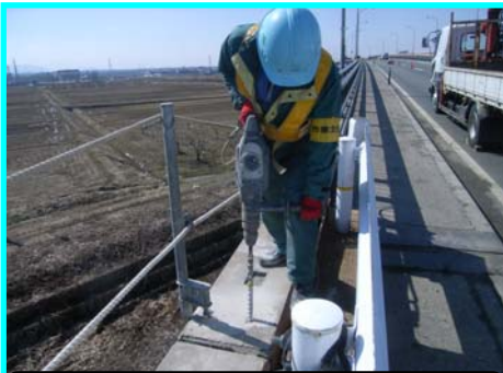
アンカーボルトを設置するための穴をあけます

→→→防護柵の基礎づくりのため、アンカーボルト(右写真の鉄筋)を埋め込みます。埋め込むことでコンクリートと防護柵のつながりを強化します。