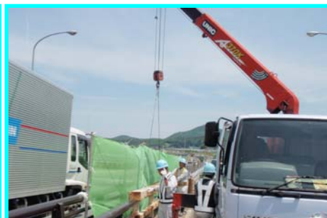
切断したらユニック車で撤去