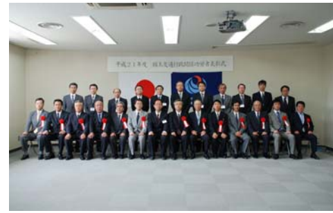
7/27に山形河川国道事務所で行われた事務所長表彰式。写真左:山田塗装(株)、写真中央:河西建設(株)