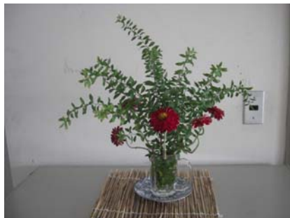
庁舎内Oさんの作品