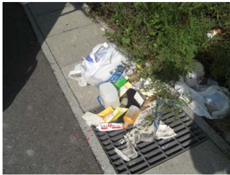
▲除湿剤(中は水が入った状態)が10個ほどまとめて捨ててありました。