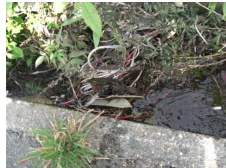
▲側溝にケーブルがまとめて捨ててあったため、詰まっていました。