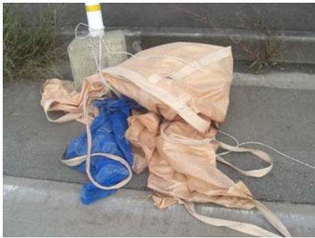
▲トンバック(大型土のう袋)。車道にできれば事故を誘発しかねません。

今回拾ったゴミ(47号2回分) 燃えるゴミ:70リットル袋3.5個分 燃えないゴミ:70リットル袋2個分