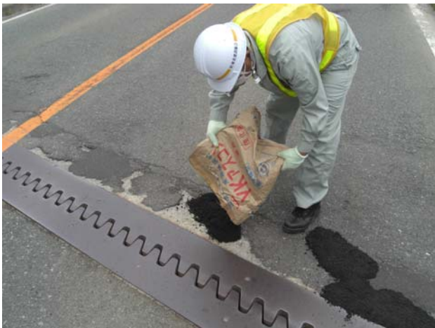
▲穴に常温合材をつめます