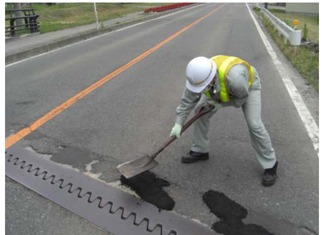
▲スコップで固めて完成