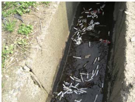
▲吸い殻はどの駐車帯にも散乱していました