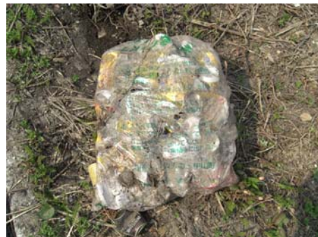
▲家庭用のゴミを捨てないでください