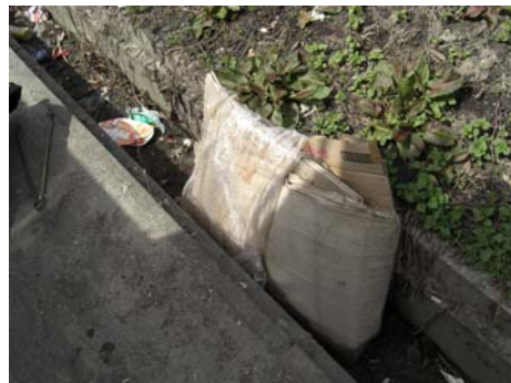
▲側溝には大小さまざまなゴミが