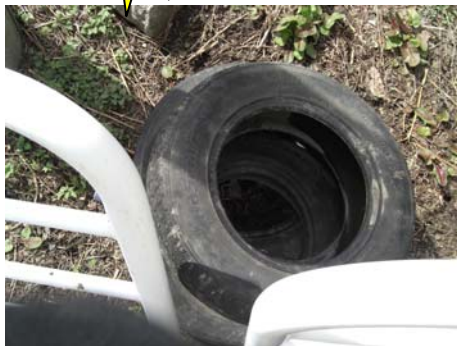
▲タイヤの不法投棄