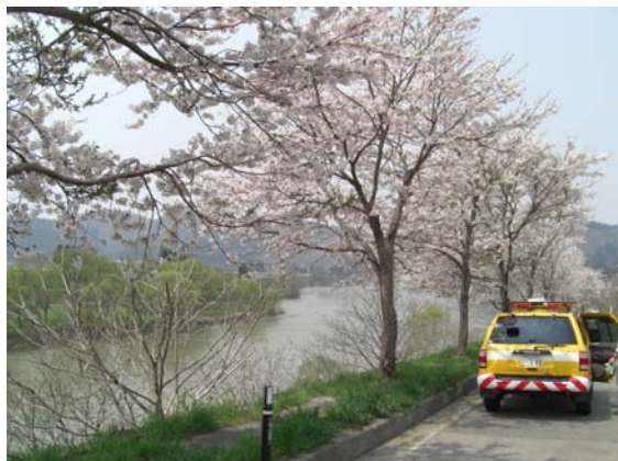
▲景色のいい駐車帯ですが、桜の木の下はタバコの吸い殻やゴミが散乱していました