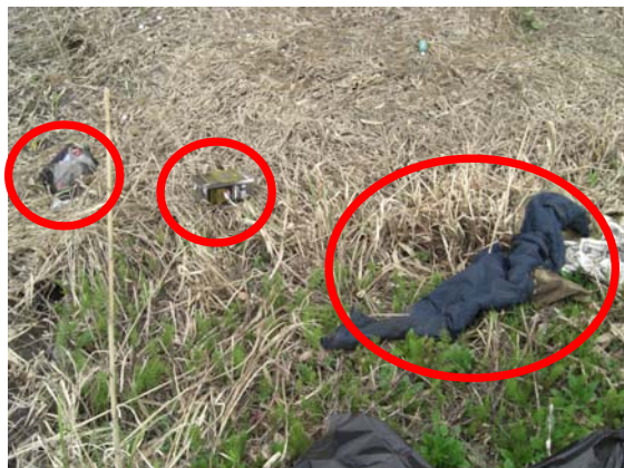
▲服・オイル缶・弁当などが散乱していました

今回拾ったゴミ(13号) 燃えるゴミ : 70リットル袋5.5つ分 燃えないゴミ: 70リットル袋3.5つ分