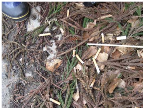
▲タバコの吸い殻。 山火事の危険性もあるのでやめてください

今回拾ったゴミ(47号) 燃えるゴミ : 70リットル袋5つつ分 燃えないゴミ : 70リットル袋1.5つつ分