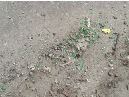
▲割れた瓶は大変危険です