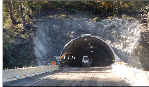
有田沢橋(酒田方向)