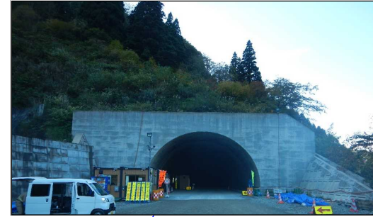
猪ノ鼻トンネル(酒田方向)