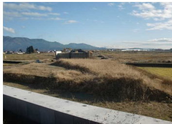
萩野地区(尾花沢方向)