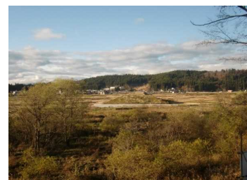
荒屋地区(湯沢方向)