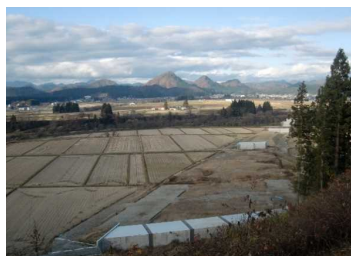
上台地区(湯沢方向)