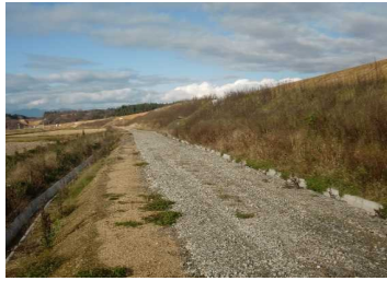
萩野地区(湯沢方向)