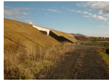
萩野地区(尾花沢方向)