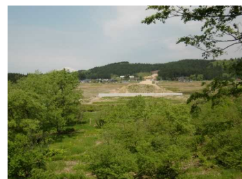
荒屋地区(湯沢方向)