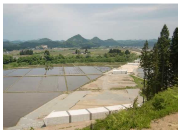
上台地区(湯沢方向)