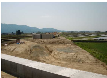
萩野地区(尾花沢方向)