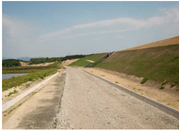
萩野地区(湯沢方向)