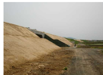
萩野地区(尾花沢方向)