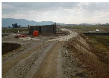
萩野地区(尾花沢方向)