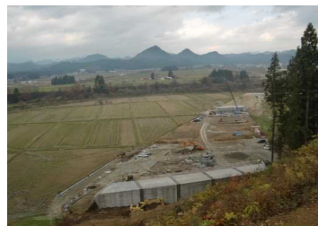
上台地区(湯沢方向)