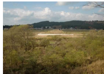
荒屋地区(湯沢方向)