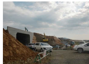
萩野地区(尾花沢方向)