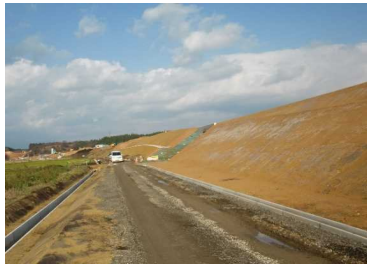
萩野地区(湯沢方向)