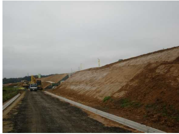
萩野地区(湯沢方向)