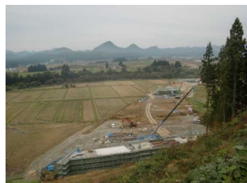
上台地区(湯沢方向)