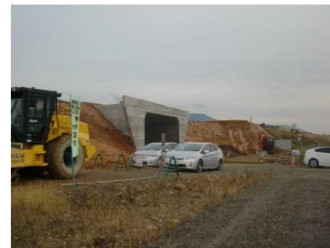
萩野地区(尾花沢方向)