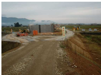
萩野地区(尾花沢方向)