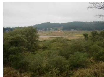
荒屋地区(湯沢方向)