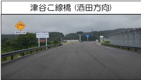
津谷こ線橋 (酒田方向)