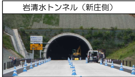
岩清水トンネル (新庄側)