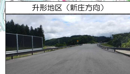
升形地区 (新庄方向)