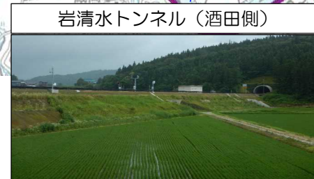
岩清水トンネル (酒田側)