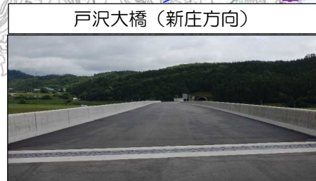
戸沢大橋 (新庄方向)