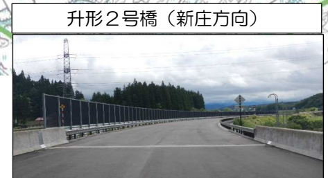
升形2号橋 (新庄方向)