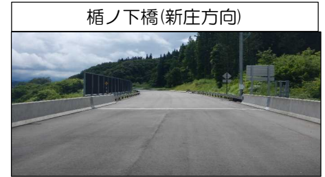
楯ノ下橋(新庄方向)