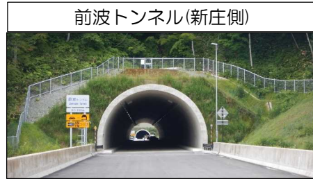
前波トンネル(新庄側)