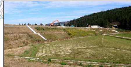
岩清水トンネル (酒田側)