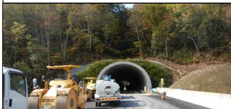
前波トンネル(新庄側)