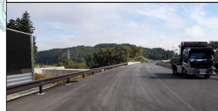
升形地区 (新庄方向)