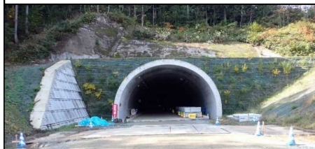
岩清水トンネル (新庄側)