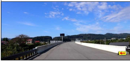
津谷こ線橋 (酒田方向)