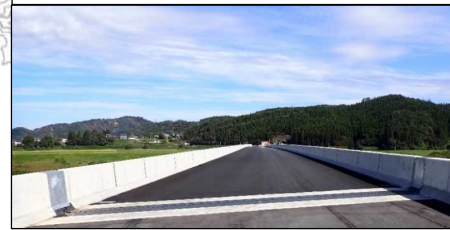
戸沢大橋 (新庄方向)