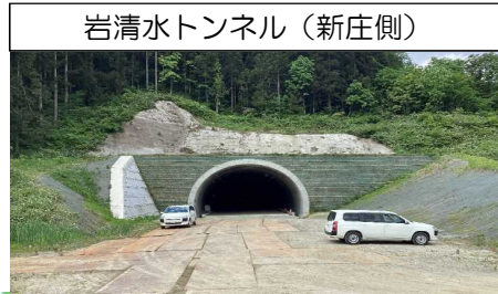
岩清水トンネル (新庄側)