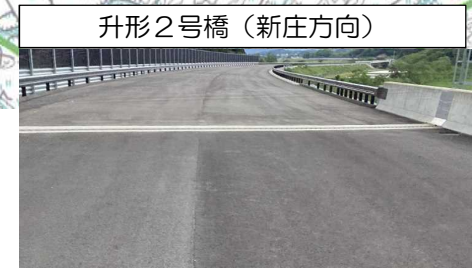
升形2号橋 (新庄方向)