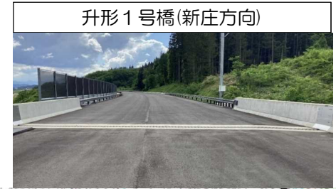
升形1号橋(新庄方向)