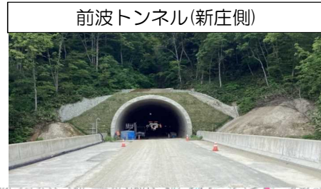
前波トンネル(新庄側)