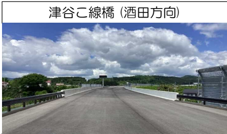
津谷こ線橋 (酒田方向)