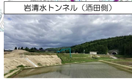
岩清水トンネル (酒田側)