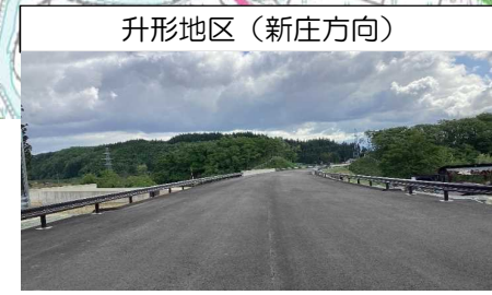
升形地区 (新庄方向)