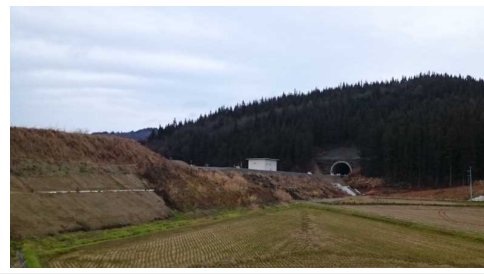
岩清水トンネル(酒田側)