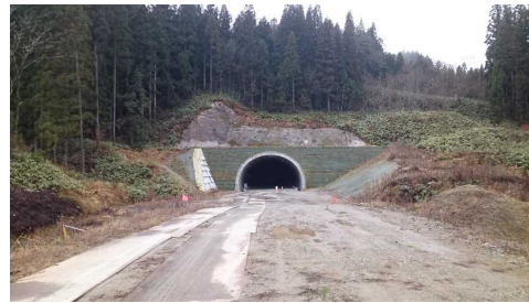
岩清水トンネル(新庄側)