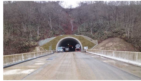
前波トンネル(新庄側)