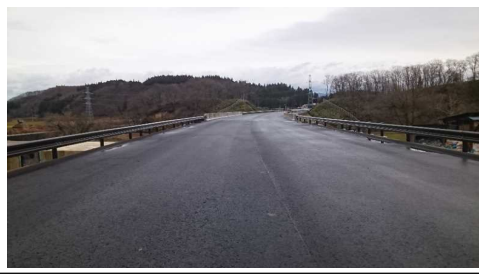
升形地区(新庄方向)