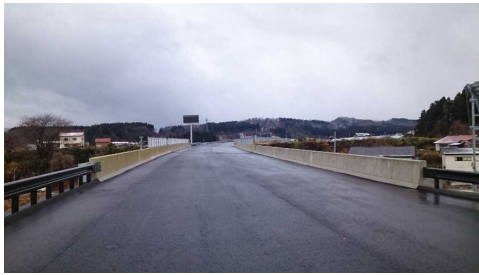
津谷こ線橋(酒田方向)