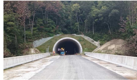
前波トンネル(新庄側)