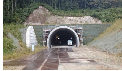
岩清水トンネル(新庄側)