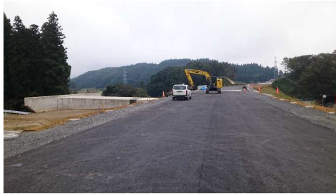
升形地区(新庄方向)