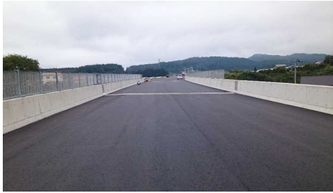
津谷こ線橋(酒田方向)