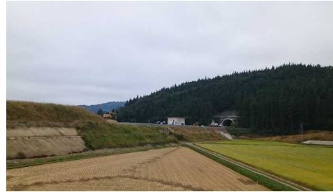
岩清水トンネル(酒田側)