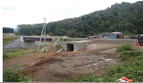
升形地区(新庄方向)