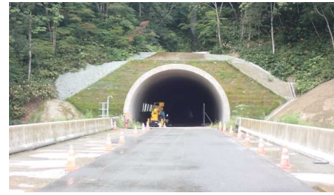
前波トンネル(新庄側)