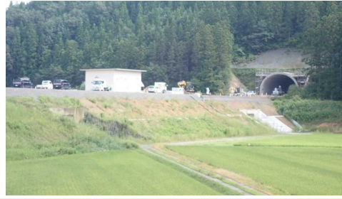
岩清水トンネル(酒田側)