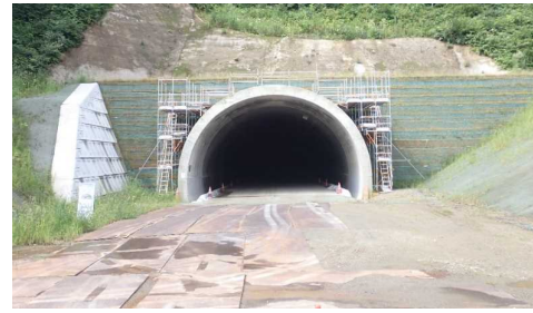
岩清水トンネル(新庄側)