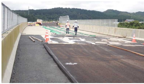
津谷こ線橋(酒田方向)