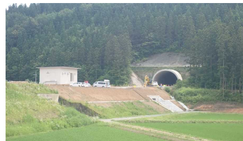
岩清水トンネル(酒田側)