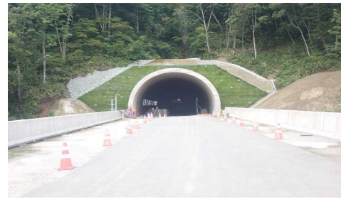
前波トンネル(新庄側)