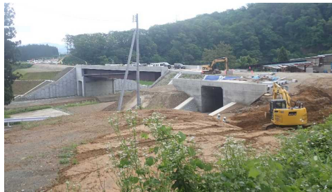
升形地区(新庄方向)