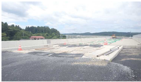
津谷こ線橋(酒田方向)