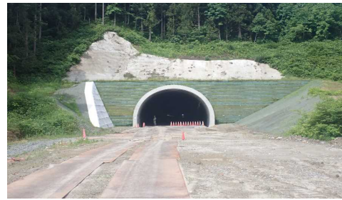
岩清水トンネル(新庄側)